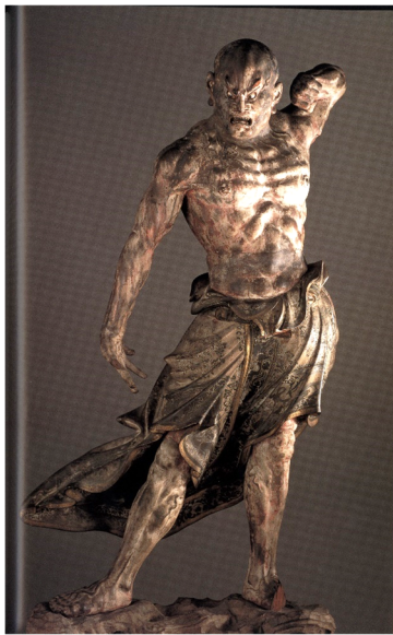
附圖3-1 興福寺仁王像