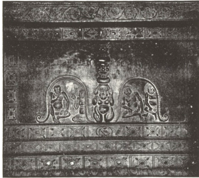
附圖8 安德森書中附圖