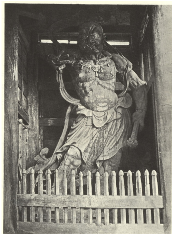
附圖5 安德森書中的東大寺仁王像插圖