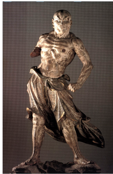
附圖3-2 興福寺仁王像