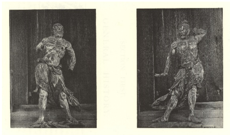
附圖4 安德森書中的興福寺仁王像插圖

資料來源：William Anderson, The Pictorial Arts of Japan , plate 1.