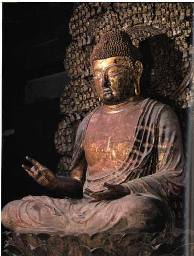
附圖9 唐招提寺主尊盧舍那佛