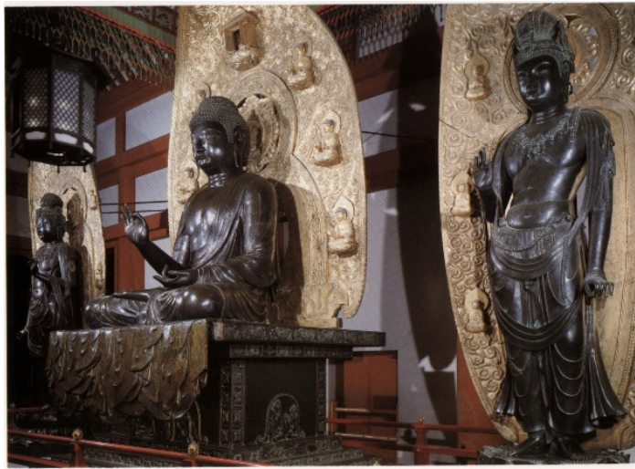
附圖6 藥師寺金堂三尊