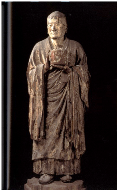
附圖2 興福寺無著像