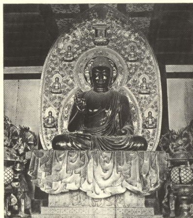
附圖7 安德森書中的藥師寺主尊插圖