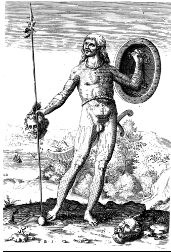
附圖6-1 皮克特人('The True Picture of One Picte')