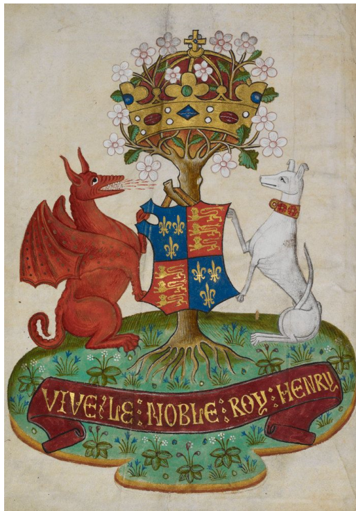
附圖2 英王亨利七世的紋章