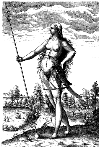
附圖6-5 皮克特人的鄰族女子 (‘The Trvve Picture of a Women Nighbour to the Pictes’)