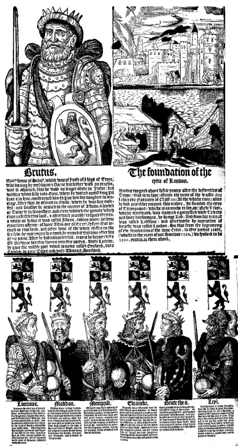
資料來源：Cyles Godet, Brief Abstract of the Genealogy of All the Kynges of England (London: By Gyles Godet, 1560?), f. 4, 5. Photo credit: Early English Books Online & The British Library, London.