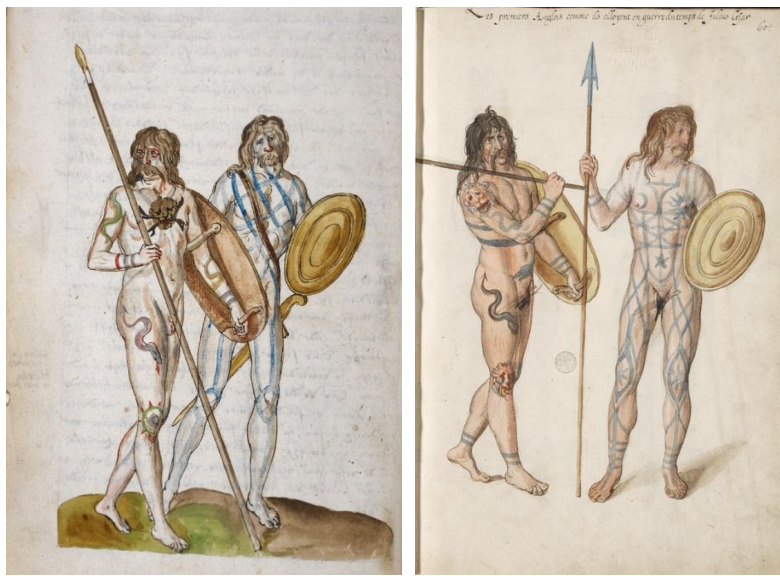
附圖 5 德·希爾的「兩位古不列顛人」(Two Ancient Britons)

資料來源：Lucas de Heere, Corte Beschryvinghe van Engheland, Schotland, ende Irland (1573-1575), British Library, Add MS 28330, f. 8v. Lucas de Heere, Théâtre de tous les peuples et nations de la terre avec leurs habits, et ornemens divers, tant anciens que modernes..... (Ghent, 1576), f. 60.