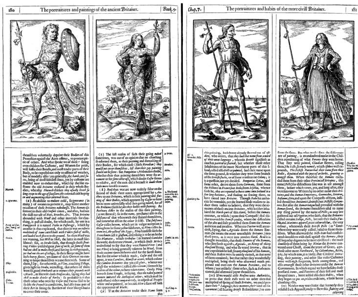
圖 7-1 史畢德《大不列顛史》中的古不列顛人與「較文明的」不列顛人