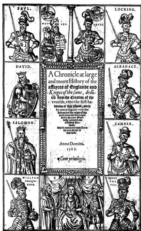
附圖 4 格拉夫頓所寫之《通鑑》的封面

資料來源：Richard Grafton, A Chronicle at Large and Meere History of the Affayres of England and Kinges of the Same from the Creaton to the Worlde..... (London: By Henry Denham, 1569), frontispiece. Photo credit: Early English Books Online & The British Library, London.