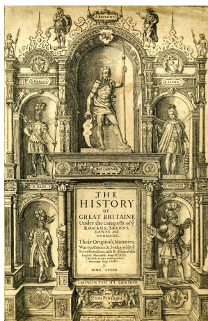
附圖 9 史畢德《大不列顛史》(1612)的封面

資料來源：John Speed, The History of Great Britaine, under the Conquests of the Romans, Saxons, Danes and Normans. Their Originals, Manners, Warres, Coines & Seales with the Successions, Lives, Acts & Issues of the English Monarchs from Iulius Caesar to our Most Gracious Soueraigne King James, frontispiece. 說明：相同的封面設計用於同時出版的《大不列顛帝國全覽》一書。