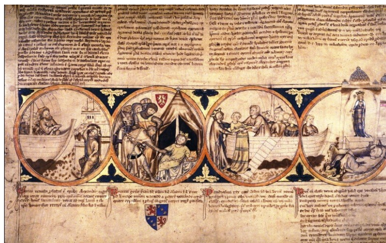
附圖1 牛津大學博德利圖書館的羊皮卷檔3