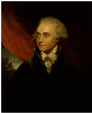
附圖 4 Sir Joshua Reynolds, Edmond Malone , 1778.