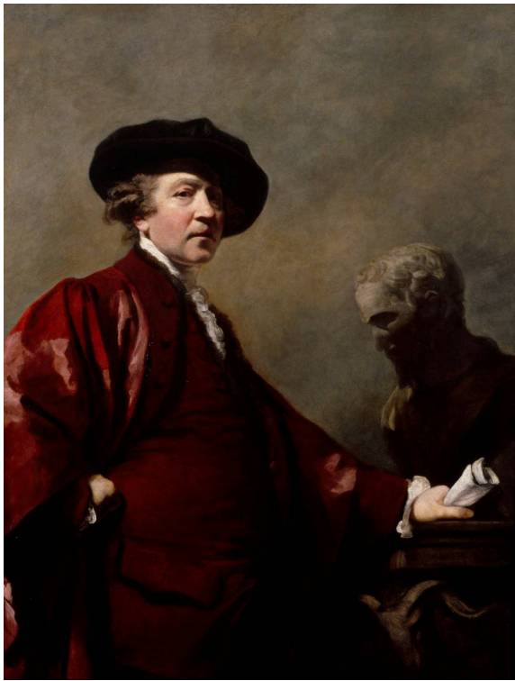
附圖 1 Sir Joshua Reynolds, Self-portrait of Sir Joshua Reynolds , 1780